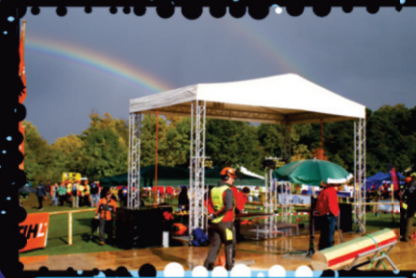
Ton, Licht, Zelte